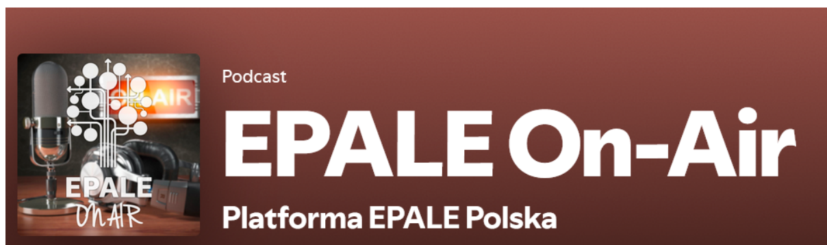
Profil EPALÉ Polska na spotify

Platforma jest otwarta na różnorodne formaty. Można na niej posłuchać serii podcastów i newscastów przygotowanych przez ekspertów edukacji dorosłych, które poszerzają wiedzę na temat zagadnień związanych z uczeniem się dorosłych. Można je również znaleźć na otwartym kanale spotify .