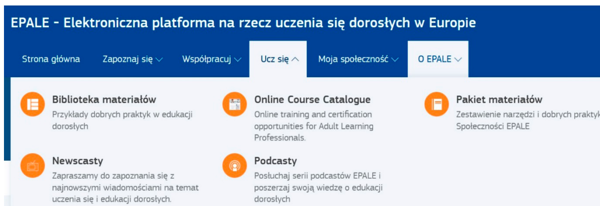
Główne zakładki strony – Ucz się

Platforma umożliwia znalezienie partnerów do projektów realizowanych w ramach programu Erasmus+ o tematyce edukacja dorosłych – zarówno mobilnościowych, jak i strategicznych.