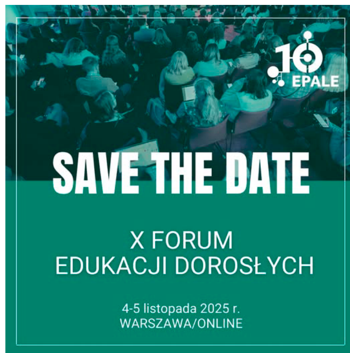
Zaproszenie na X Forum Edukacji Dorosłych

Udział w Forum Edukacji Dorosłych jest bezpłatny. Warunkiem uczestnictwa jest posiadanie aktywnego konta na platformie EPALE. Znana jest również data jubileuszowego, X Forum Edukacji Dorosłych – w dniach 4–5 listopada 2025 r. odbędzie się ono w Warszawie i on-line. Podczas dwóch dni organizatorzy zaproszą uczestników do udziału w wykładach, panelach dyskusyjnych i warsztatach. Osoby, które nie będą mogły przybyć do Warszawy, będą miały możliwość udziału on-line. Przewidziana jest pełna transmisja z możliwością interakcji i dzielenia się swoimi doświadczeniami. Wszystkie wystąpienia w sesji plenarnej będą tłumaczone na polski język migowy.