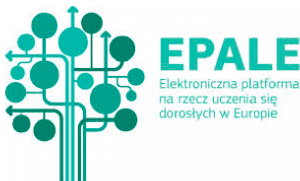
Logo EPALÉ Polska – materiały promocyjne Krajowego Biura EPALÉ

Platforma jest otwarta na różnorodne formaty. Można na niej posłuchać serii podcastów i newscastów przygotowanych przez ekspertów edukacji dorosłych, które poszerzają wiedzę na temat zagadnień związanych z uczeniem się dorosłych. Można je również znaleźć na otwartym kanale spotify .